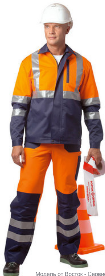
Модель от Восток - Сервис

Среди них универсальные серебристые и лимонные ленты, устойчивые к частым промышленным стиркам, а также огне- и термостойкие ленты для огнестойкой одежды, которую носят работники нефтегазовой и металлургической отраслей промышленности. Новинкой в нашем ассортименте стала огнестойкая световозвращающая лента ВИЗЛАЙТ Vizlite 305 FR Тройная полоса. Ее особенностью является совмещение сигнальных и световозвращающих свойств.