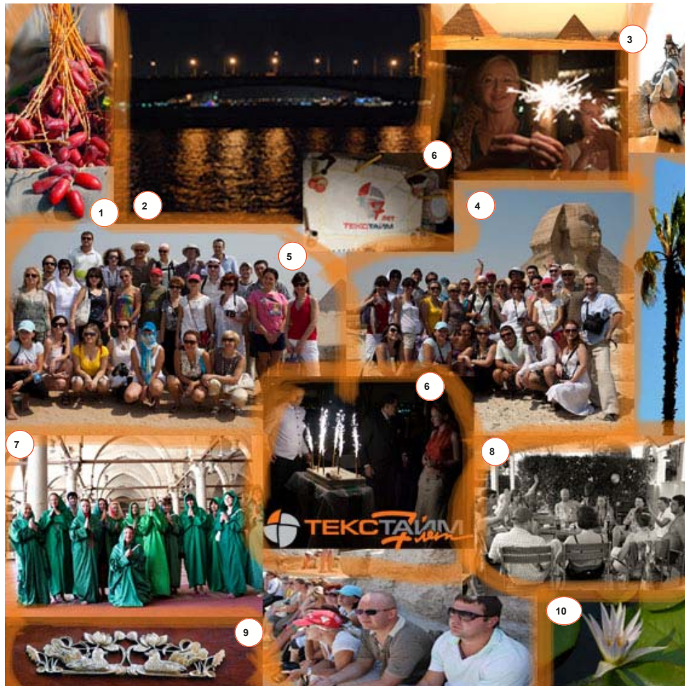
ГК ТЕКСТАЙМ вместе работаем, вместе отдыхаем.

(1) Финики, оказывается, красные и похожи на сладкую редиску. (2) Каирская ночь опустилась на воды Нила. (3) Древние пирамиды. (4) ГК Текстайм на фоне Сфинкса. Говорят, что Сфинкс помнит Всемирный Потоп, Фараонов, Наполеона и многое другое. (5) 7 лет—магический возраст. У седых пирамид. Вместе работаем, вместе отдыхаем. (6) Торт с логотипом ждал нас в Каире, когда стрелки часов показали 12 часов по полуночи. Мы загадали желание и вместе задули свечи. (7) Свободные женщины Текстайма в мечети Каира. (8) Мы играли в Мафию от заката до рассвета. «Странные, эти русские», - думали иностранцы, глядя на нас—веселящихся, машущих руками, сидящими в круге и совершающих непонятные действия. (9) Уточки — символы любви и верности (типичный узор для покоев Нефертити). (10) Цветок лотоса— символ царственности, мудрости и просветления.