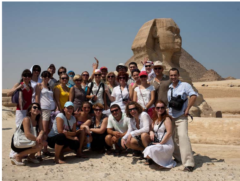
Еще неизвестно, что древнее, Пирамиды или Сфинкс.